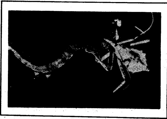
Larva de Mocis latipes "falso medidor" atacada por chinche Zelus sp.

En Carimagua, en los meses de julio y agosto de 1980 se registraron tres hongos entomocidas de M. latipes : Beauveria sp., registrado en pupas y larvas y del cual se tienen tres aislamientos; Nomuraea sp.; y Metarhizium sp. Estos dos últimos se han registrado en larvas. Este insecto es también controlado, pero más efectivamente en el estado de larva por una entidad viral aún desconocida. Muchas pupas de M. latipes se encontraron parasitadas por Beauveria sp. en la parte basal de la macolla de la gramínea nativa "rabo de zo-