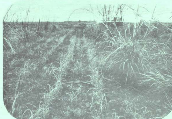
Figura 2. Andropogon gayanus establecido mediante el método de siembra rara, en Carimagua. Las semillas en el fondo de los surcos dejados por la cultivadora, dan la impresión de haber sido sembradas a propósito en hileras.

Cabe anotar la importancia de no sobrepreparar el terreno intermedio, el cual debe presentar una superficie rugosa para evitar la erosión y retener la semilla depositada por el viento. Esto se observa claramente en la Figura 2. Los surcos de