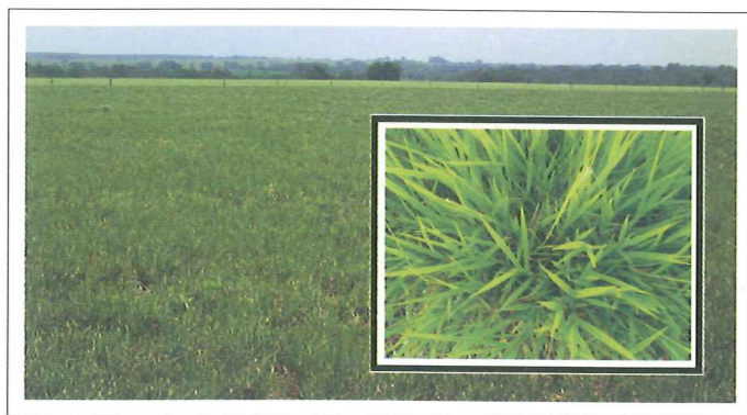
Pastura de Brachiaria brizantha CIAT 26990 en una finca de la altillanura. Nótese su intenso color verde y proporción de hojas.

Brachiaria brizantha CIAT 26124 fue clasificada con la nota más alta por los productores por su alta proporción de hojas, además de grandes y suaves. Una ventaja que ven los productores con esta accesión es su rápida recuperación después del pastoreo y la producción de estolones con buen enraizamiento.