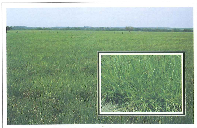
Pastura de Brachiaria brizantha CIAT 26318 en una finca de la altillanura. Nótese su vigor.

Brachiaria brizantha CIAT 26318 se recupera rápidamente después del pastoreo, pero no parece ser muy palatable al ganado dado su alta proporción de tallo.