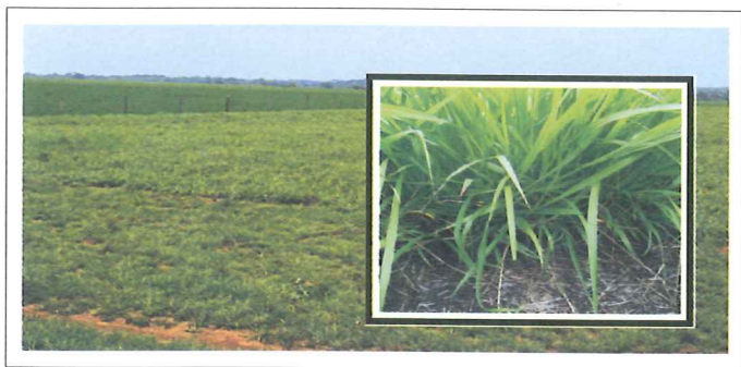
Pastura de Brachiaria brizantha CIAT 26124 en una finca de la altillanura. Nótese su alta proporción de hojas y producción de estolones. (Foto cortesía de B. Hincapié).

Brachiaria brizantha CIAT 26124 fue clasificada con la nota más alta por los productores por su alta proporción de hojas, además de grandes y suaves. Una ventaja que ven los productores con esta accesión es su rápida recuperación después del pastoreo y la producción de estolones con buen enraizamiento.