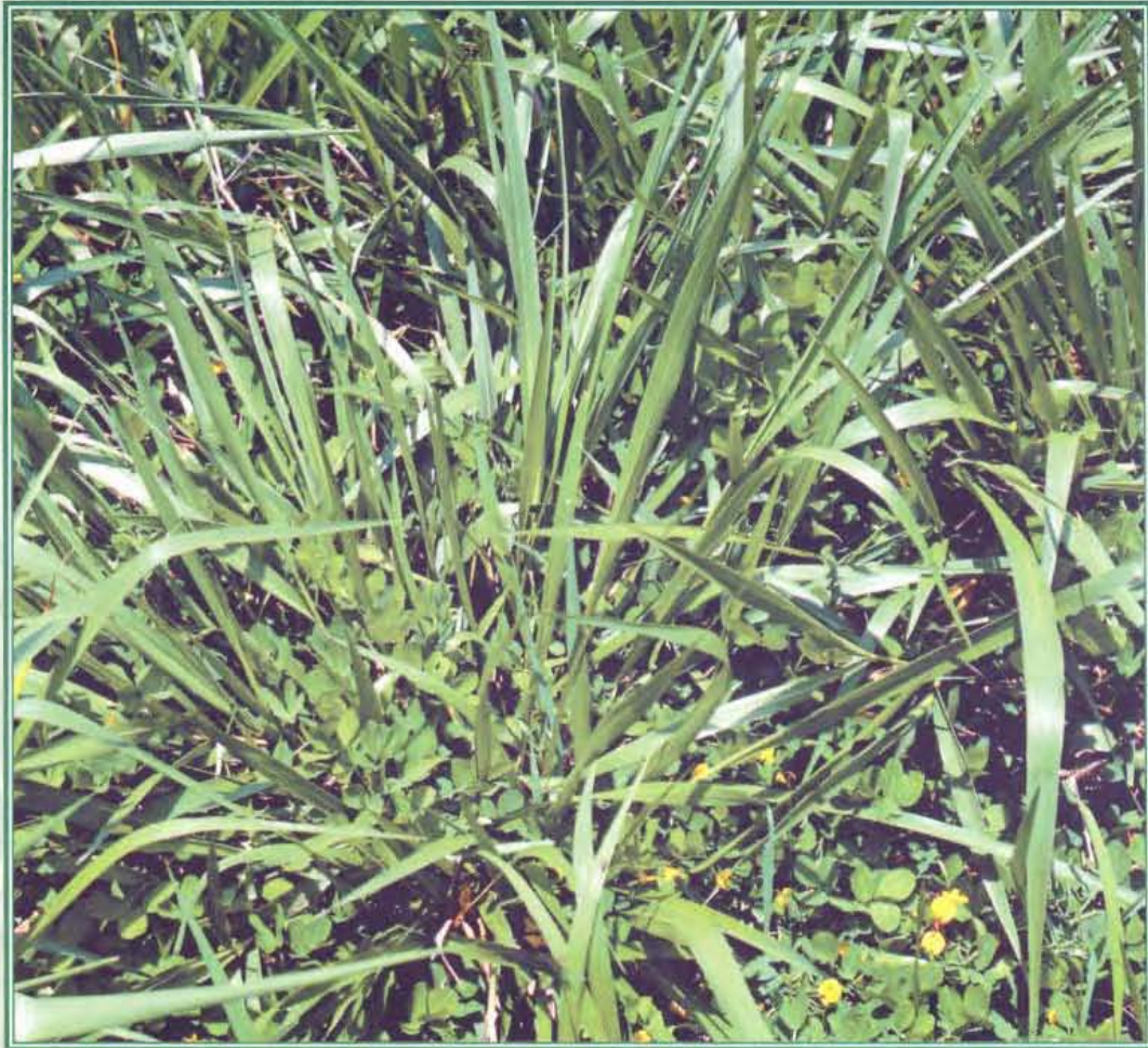
Brachiaria brizantha CIAT 26110 cv. Pasto Toledo asociado con Arachis pintoii CIAT 22160 en una finca de Atenas, Costa Rica.