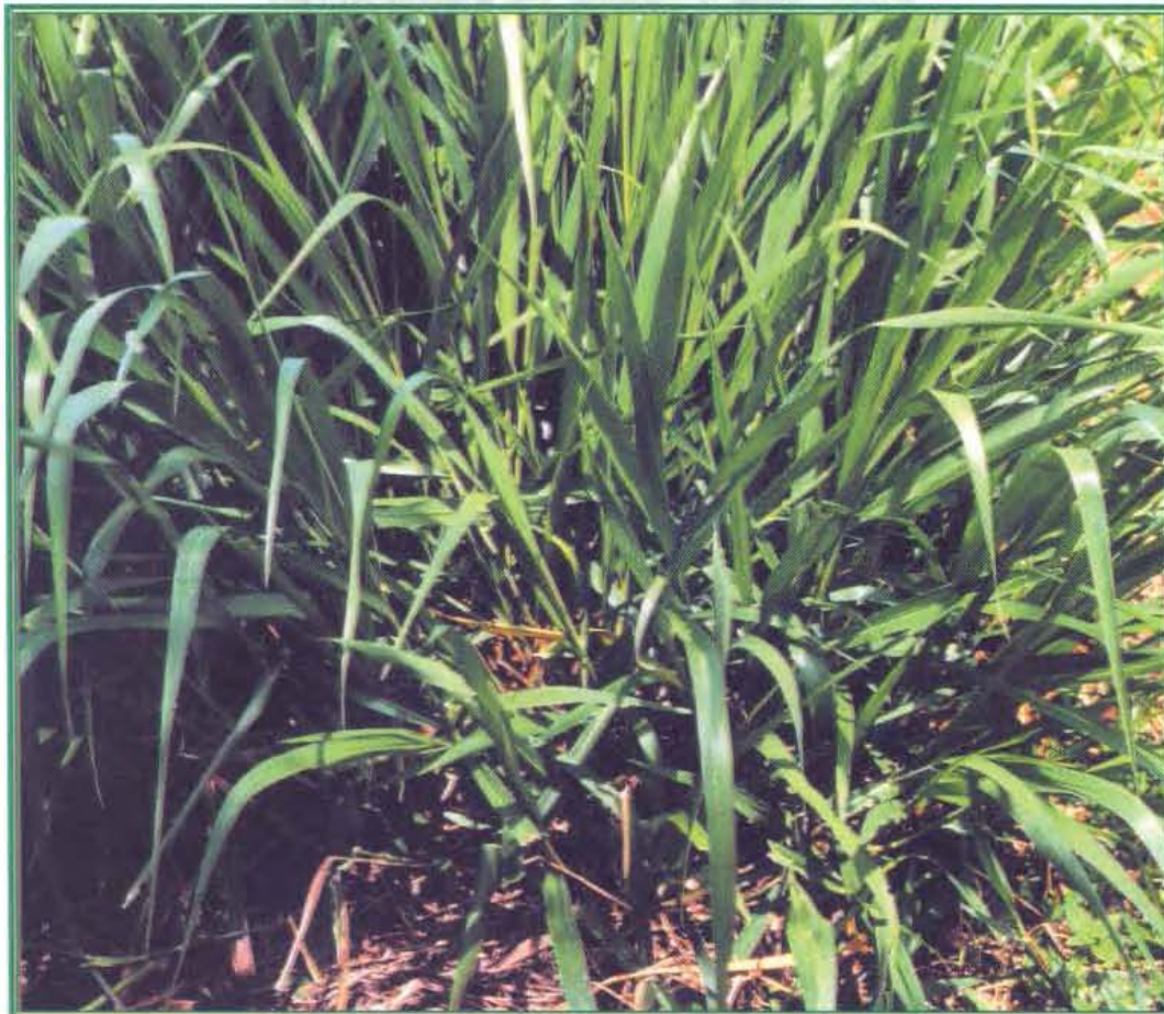
Planta de cv. Pasto Toledo ( Brachiaria brizantha CIAT 26110). Obsérvese el buen desarrollo de tallos y macollas.

El cv. Pasto Toledo se derivó directamente de la accesión B. brizantha CIAT 26110. Es una gramínea perenne que crece formando macollas y puede alcanzar hasta 1.60 m de altura. Produce tallos vigorosos capaces de enraizar a partir de los nudos cuando entran en estrecho contacto con el suelo, bien sea por efecto del pisoteo animal o por compactación mecánica, lo cual favorece el cubrimiento del suelo y el desplazamiento lateral de la gramínea. Las hojas son lanceoladas con poca pubescencia y alcanzan hasta 60 cm de longitud y 2.5 cm de ancho. La inflorescencia es una panícula de 40 a 50 cm de longitud, generalmente con cuatro racimos de 8 a 12 cm y una sola hilera de espiguillas sobre ellos. Cada tallo produce una o más inflorescencias provenientes de nudos diferentes, aunque la de mayor tamaño es la terminal.