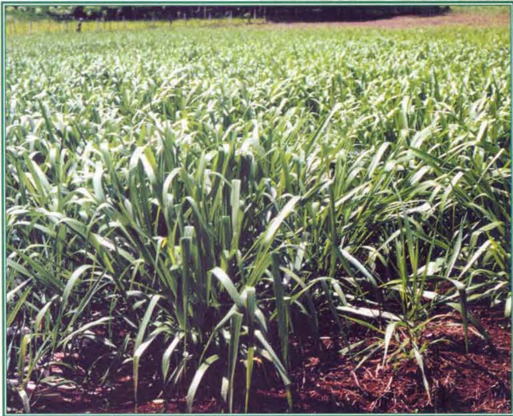
Lote de Brachiaria brizantha cv. Pasto Toledo, 45 días después de la siembra en un suelo preparado convencionalmente con arado y rastra. Nótese el vigor de las plantas y su crecimiento en macollas.

El alto vigor de las plántulas y el crecimiento agresivo inicial de este cultivar le permiten competir adecuadamente con las malezas durante la fase de establecimiento, siendo posible un primer pastoreo entre 3 y 4 meses después de la siembra, tal como lo muestran las experiencias de varios productores en Costa Rica.