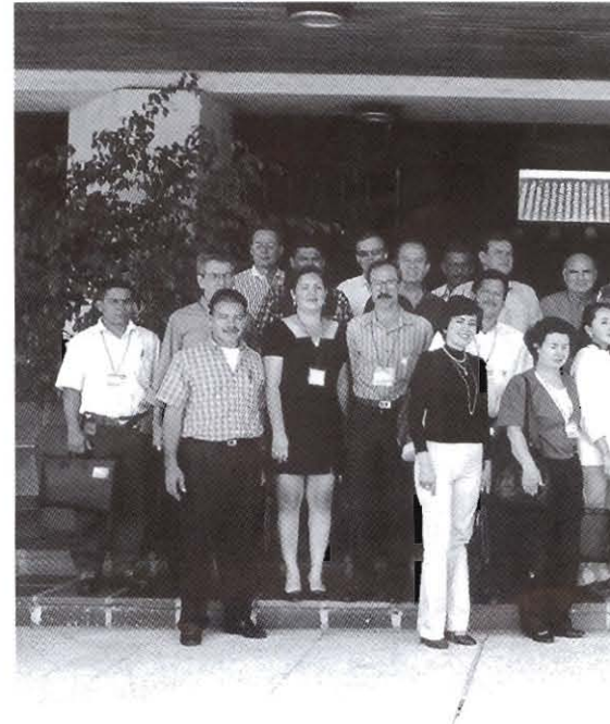
Participantes en la Reunión