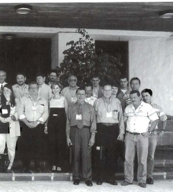
Formación de CLAYUCA realizada el 12 de abril de 1999.

beneficiar a todos los países participantes.