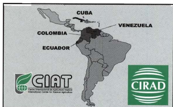
Países e instituciones miembros del Consorcio

Sin embargo, recientemente este modelo de apoyo público a la investigación dejó de ser viable, obligando a instituciones y países a organizarse y establecer alianzas estratégicas para continuar con estas actividades.