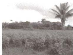
Cultivo de Cratylia argentea en los Llanos Orientales de Colombia.

Pedro J. Argel Guillermo Giraldo Michael Peters Carlos E. Lascano Camilo H. Plazas