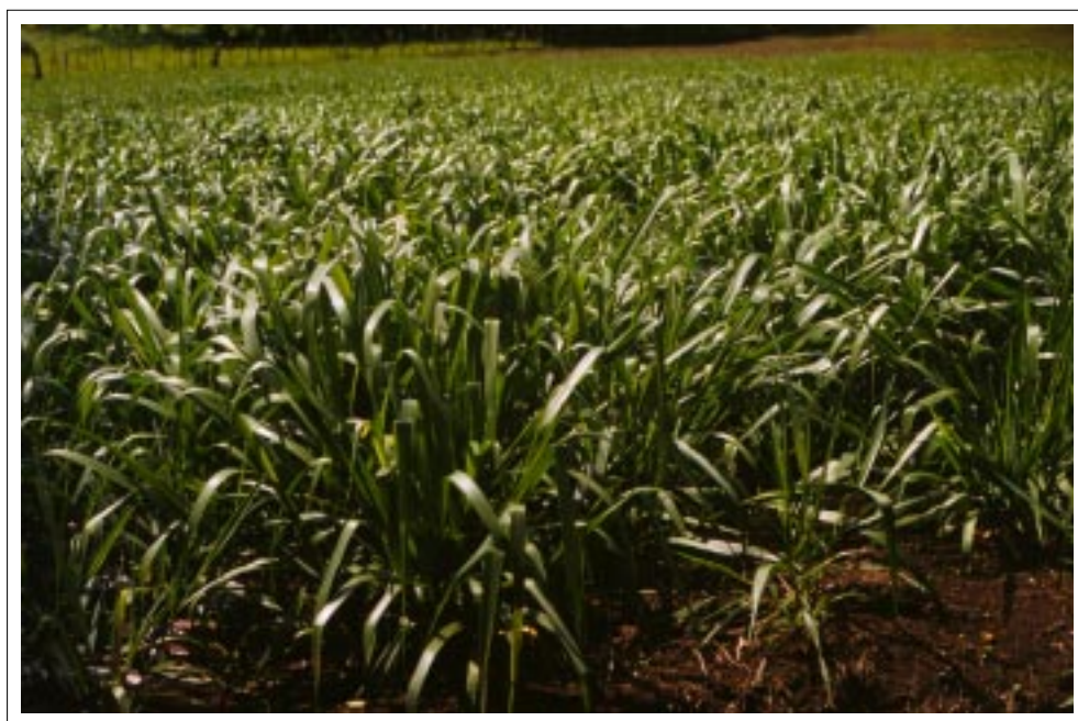
Pastura de Pasto Toledo Brachiaria brizantha (CIAT 26110), 45 días después de la siembra en un lote preparado convencionalmente con arado y rastra. Nótese el vigor de las plantas y su crecimiento macollado.

La siembra puede ser a voleo o en surcos separados 0.5 m sobre el terreno preparado convencionalmente con arado y rastrillo, o después de controlar la vegetación con herbicidas no-selectivos mediante prácticas de cero labranza. La cantidad de semilla a utilizar depende de su valor cultural (porcentajes de pureza y germinación) y del método de siembra. Así, las siembras en surcos en suelos adecuadamente arados y rastrillados requieren menor cantidad de semilla, en comparación con las siembras a voleo sobre suelos con cero o mínima labranza. La cantidad final varía entre 3 y 4 kg/ha para una semilla con un valor cultural de 60% (por ej., 80% de pureza y 75% de germinación). Se ha observado una mayor emergencia de plántulas en siembras con material vegetativo que a voleo, lo cual puede estar asociado con un mejor contacto entre la humedad en el suelo y la semilla gámica en la siembra con el primer método.