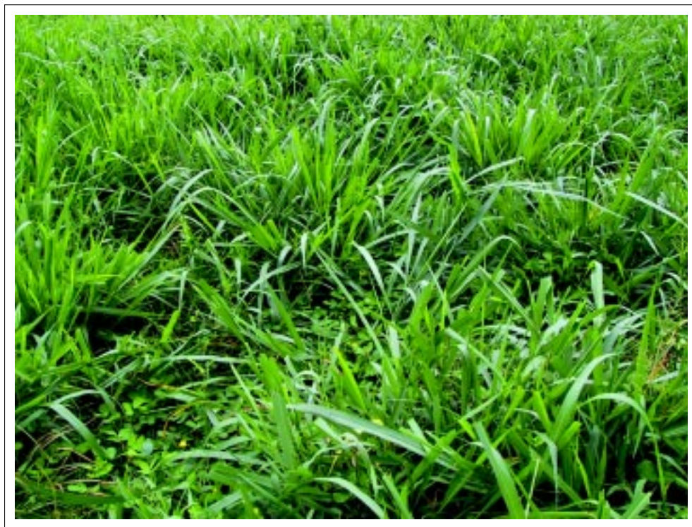
Pasto Toledo - Brachiaria brizantha (CIAT 26110) asociado con Arachis pintoi CIAT 18748.

del suelo y una mejor calidad forrajera. Lo anterior se ha observado en pasturas asociadas actualmente bajo evaluación. Aunque es una gramínea adecuada para pastoreo, podría también ser utilizada en sistemas de corte y acarreo por su alto vigor de crecimiento.