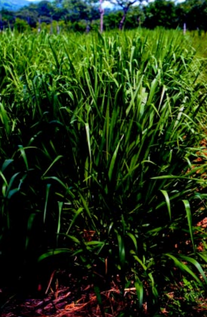
Planta de cv. Toledo - Brachiaria brizantha CIAT 26110. Obsérvese el buen desarrollo de tallos y macollas.

Crece bien durante la época seca manteniendo una mayor proporción de hojas verdes que otros cultivares de la misma especie, como B. brizantha cvs. Marandu y La Libertad, lo cual parece estar asociado con un alto contenido de carbohidratos no-estructurales (197 mg/kg de MS) y poca cantidad de minerales (8% de cenizas) en el tejido foliar (CIAT, 1999).