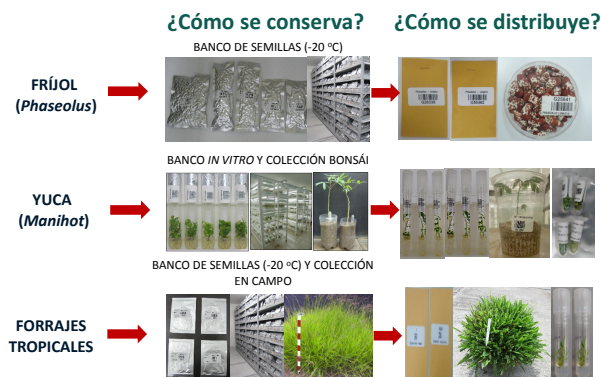
Figura 1. Esquema de conservación y distribución de las colecciones mantenidas en CIAT bajo fideicomiso.

Para la distribución de muestras de la colección clonal, es decir, del cultivo de yuca, el banco de germoplasma distribuye entre tres a cinco tubos de ensayo con plántulas in vitro debidamente rotulados con códigos de barras. También se entrega follaje cuando es solicitado y en ocasiones excepcionales, se entregan plantas establecidas en vasos plásticos (envíos nacionales).