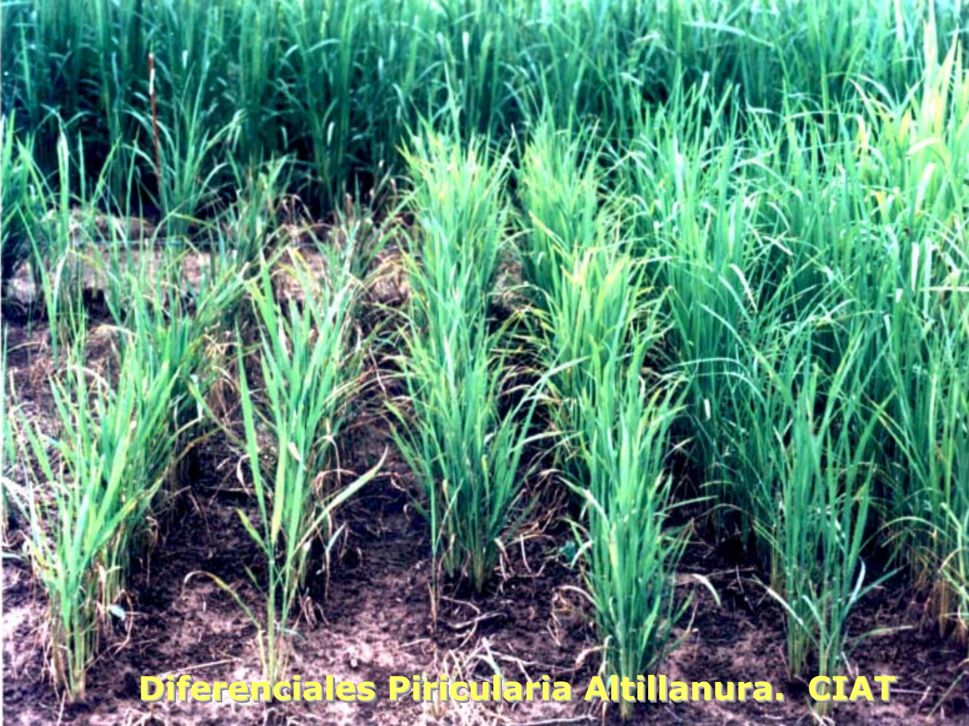
Diferenciales Piricularia Altillanura. CIAT