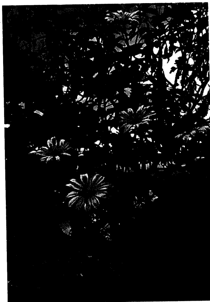
La biomasa de Tithonia diversifolia se descompone rápidamente y libera N que puede ser absorbido por el cultivo asociado

En el experimento de campo, a las 20 semanas, la descomposición de la materia seca y la liberación de N siguieron un modelo exponencial negativo. La descomposición de la materia seca siguió el orden: TIT > IND > MPTL > MPBR > CAN = MPIT = MDEE > MPITx > INDx > CRA = MPITt > INDt. La liberación de N siguió el orden: IND > INDx > MDEE > MPBR > TIT = CAN > MPTL > MPIT > INDt > MPITx > CRA > MPITt (Cuadro 1). La descomposición de la materia seca correlacionó con los niveles iniciales de N, K, Mg, lignina (L), FAD, FDN, DIG y con las tasas C/N, L/N y (L+polyphenol)/N de los materiales de la planta. La liberación de N correlacionó con N inicial, L, FAD, FND, DIG y las tasas L/N y (L+polyphenol)/N. La combinación de tallos y hojas cambió la dinámica de descomposición de la materia seca y de la liberación de N.