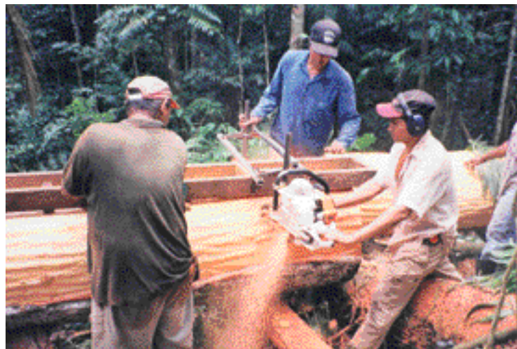
En Toncontín, el aprovechamiento se realiza mediante técnicas de tala dirigida y motosierra con marco para la obtención de madera en bloques

producirían un aumento de más de 9% en los retornos. Debido que el 'bosque primario' está en proceso de convertirse en 'bosque intervenido', la abundancia y número de especies no maderables pueden variar en este estrato, lo cual causaría un efecto negativo en el aporte que tendrían los PNMB en la rentabilidad financiera de la actividad. Por consiguiente, es recomendable estudiar cómo asegurar la presencia de estas especies en los bosques en proceso de ser intervenidos.