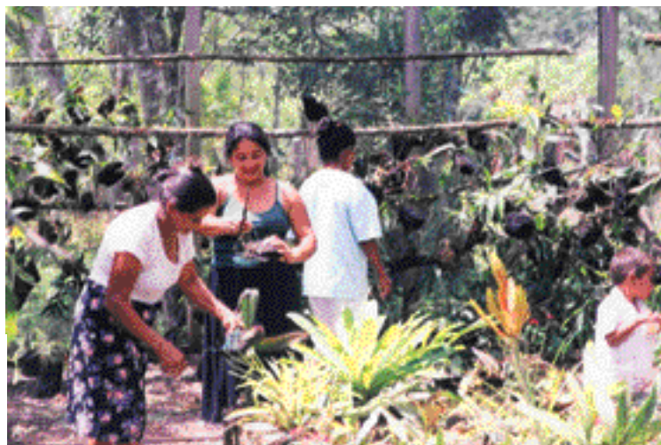
La construcción del orquidario ha permitido la integración de las mujeres de la comunidad a la actividad forestal. Las mujeres se encargan de la propagación y comercialización de orquídeas y otras plantas ornamentales procedentes del bosque

El valor del servicio ambiental de regulación hídrica fue derivado del costo de oportunidad de la tierra, en términos de la ganancia neta reportada por la ganadería extensiva (doble propósito) en las zonas aledañas. Los costos e ingresos de la actividad fueron estimados por medio de entrevistas con productores de Yaruca. Se realizó además un análisis de carácter exploratorio del contexto institucional y del marco legal en materia de recursos naturales, para sustentar futuros acuerdos de pago por servicios ambientales.