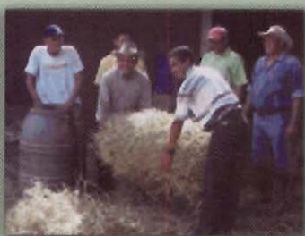
Pacas de heno

5. Acarrear/transportar y almacenar el heno en un lugar seco con techo o en montones bajo plástico fuera del alcance del ganado.