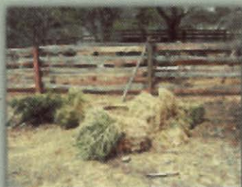
Manojos de heno de Brachiaria híbrido cv. Mulato