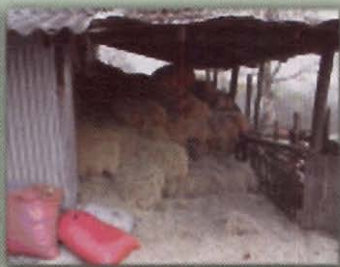
Heno suelto y en fardos bajo techo