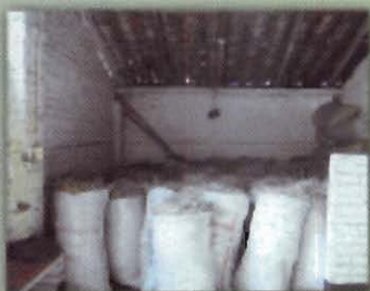
Sacos de heno de B. brizantha cv. Toledo