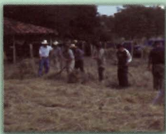
Brachiaria híbrido cv. Mulato secándose y volteado

La duración del secado depende del tiempo (temperatura, humedad y viento), de la humedad del forraje y de su textura. El secado debe ser hecho lo más rápidamente posible para minimizar las pérdidas. Un tiempo favorable (seco y caliente) permite secar, recoger y almacenar el material en 1-2 días.