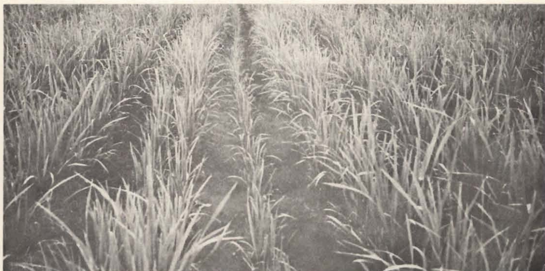
Figura 5. El contraste entre el pobre desarrollo del surco central dejado sin fertilizar por error de la abonadora en un cultivo comercial, en comparación con el resto del lote, demuestra la magnífica respuesta a la fertilización que presenta el cultivo en el lugar.