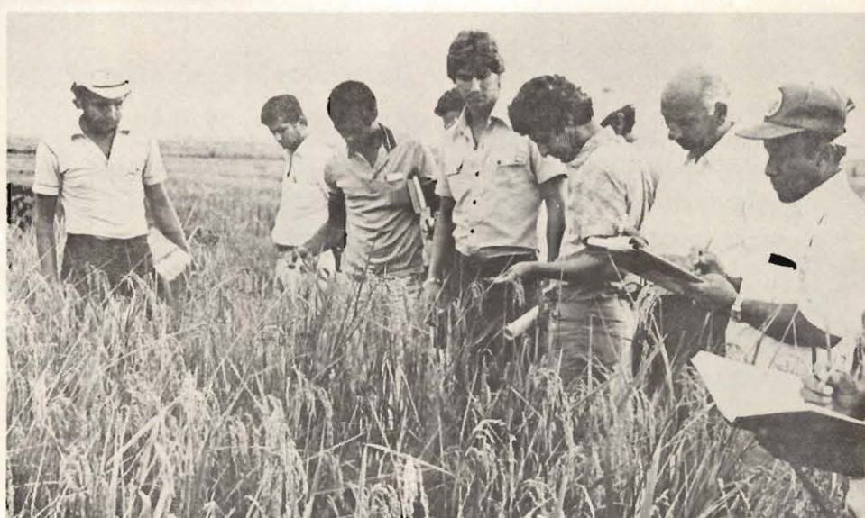
Figura 2. Dos miembros del grupo de observación y técnicos de EMPA evalúan un cultivo de arroz de secano.