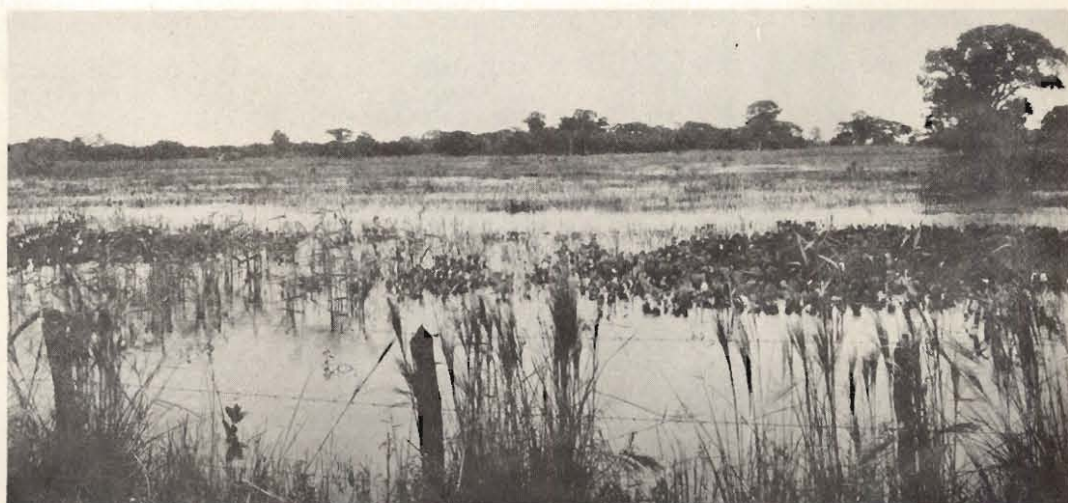
Figura 3. Pantanado es una zona baja inundable, donde la investigación en arroz tiene prioridad de segundo orden después de la ganadería, los búfalos y los pastos.