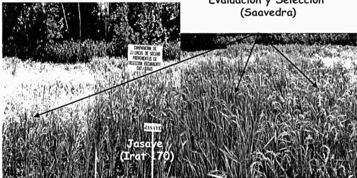
Foto 10. Líneas avanzadas evaluadas por la Universidad de Tucumán, San Miguel de Tucumán, Argentina.

Líneas S3 Evaluación y Selección (Saavedra)