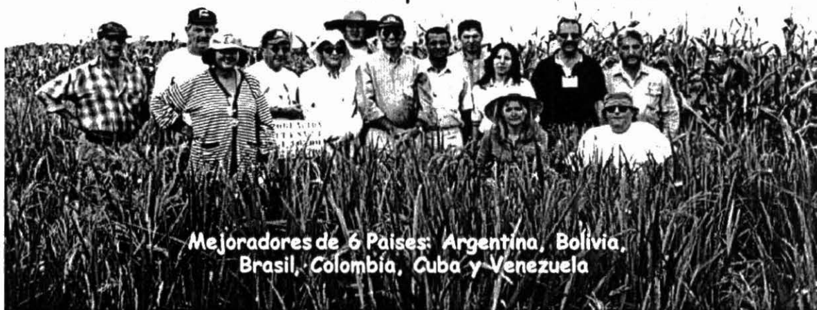
Mejoradores de 6 Países: Argentina, Bolivia, Brasil, Colombia, Cuba y Venezuela