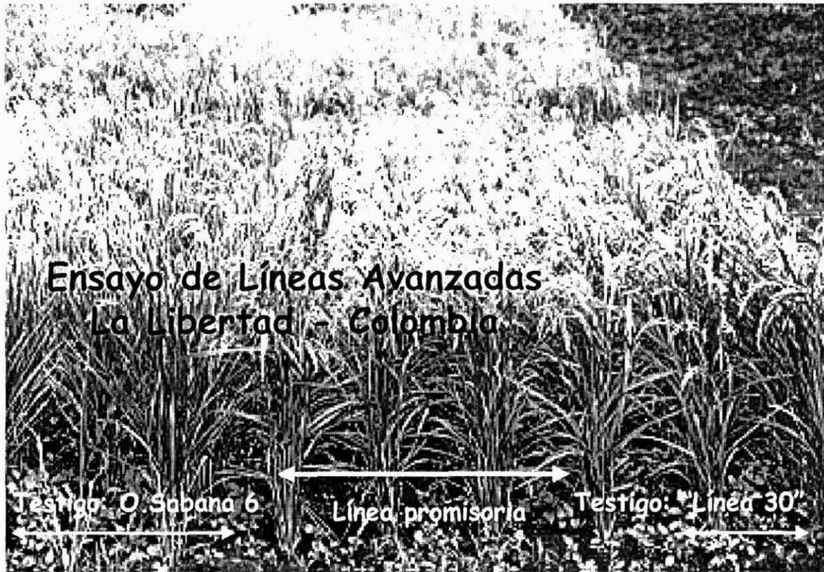
Foto 14. Poblaciones sometidas a selección recurrente para adaptación a las condiciones de Sabana.