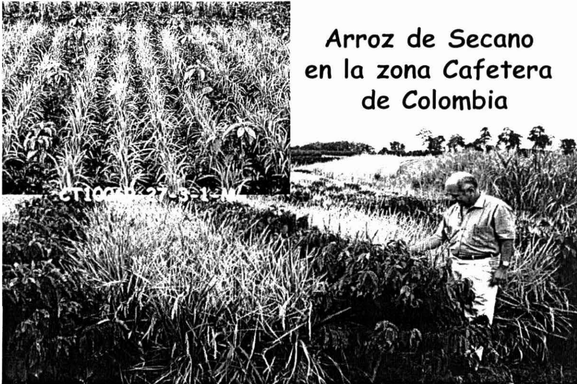
Foto 4. Siembra de materiales introducidos, realizada por Cenicafe y el Centro de Agricultura Orgánica (CIAO), Colombia.