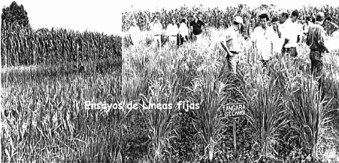
Foto 12. Líneas de arroz de secano obtenidas de las poblaciones mejoradas por el proyecto CIRAD/CIAT. Estación Experimental La Libertad, Villavicencio-Meta, Colombia.