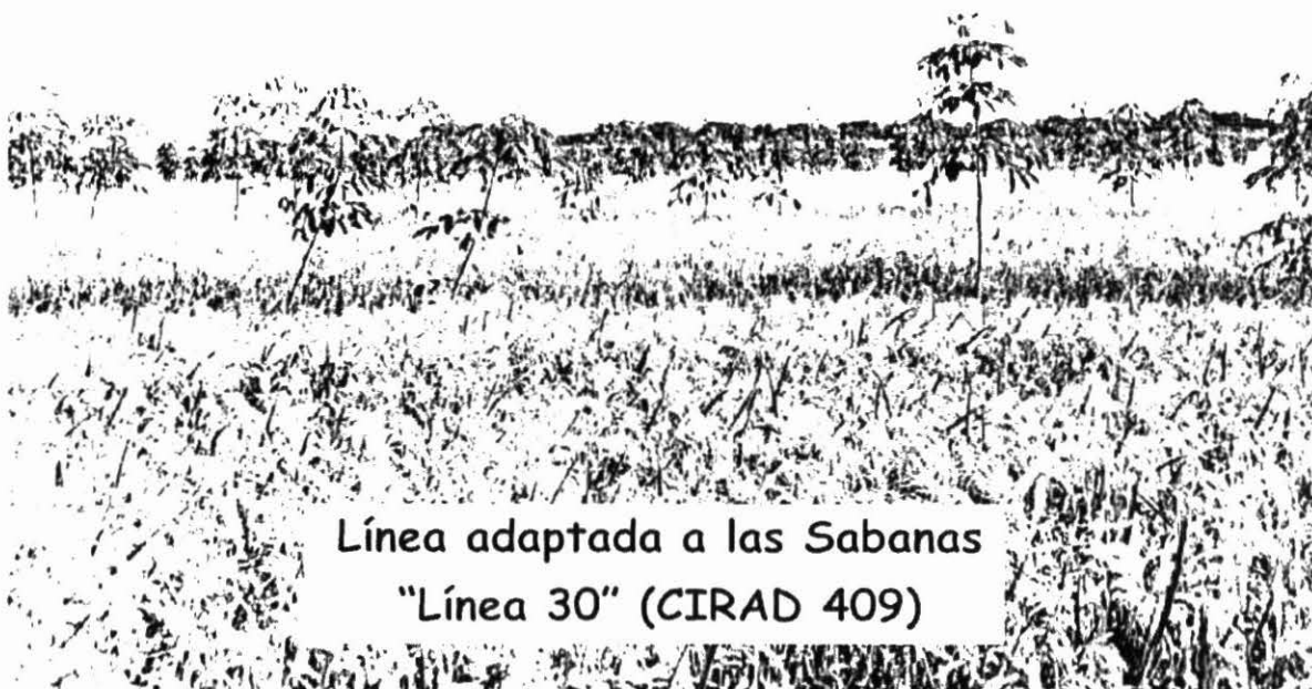
Línea adaptada a las Sabanas “Línea 30” (CIRAD 409)