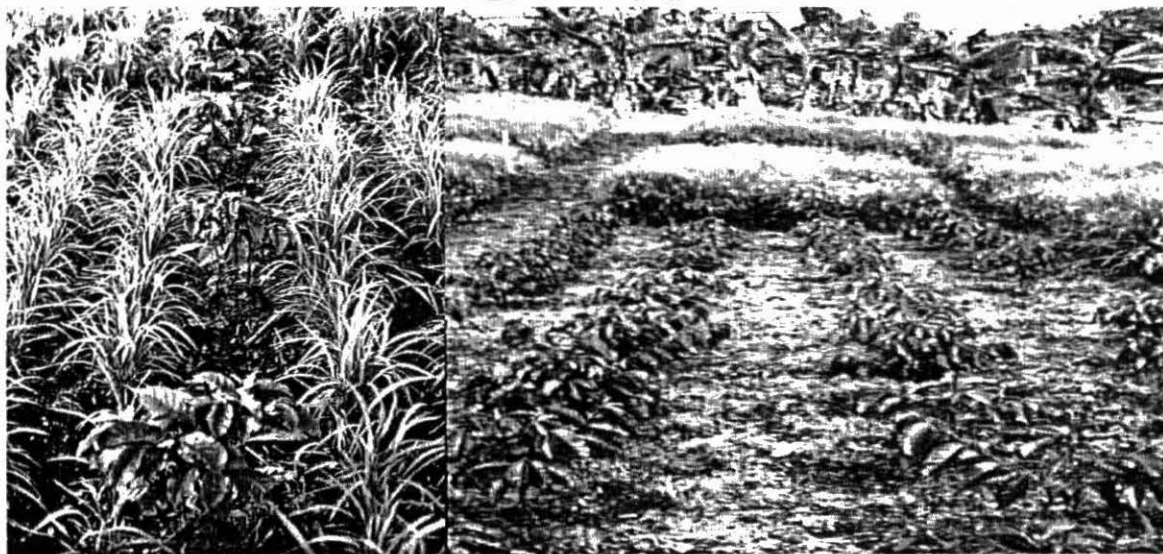
Foto 6. Evaluación de líneas de arroz de secano en el INIA Guárico-Venezuela.