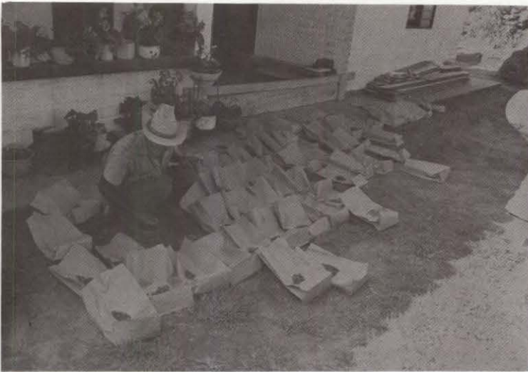
En casa, Gerardo Valencia selecciona los frijoles por su calidad de grano.

de vender. En tiempos de bajos precios, un tipo de grano comercialmente superior les permitirá por lo menos vender su cosecha, mientras que un grano de inferior calidad será difícil de vender. Si el agricultor puede obtener una variedad que, además de un tipo de grano aceptable, produce buen rendimiento y es resistente a enfermedades, entonces el fitomejorador habrá hecho su trabajo.