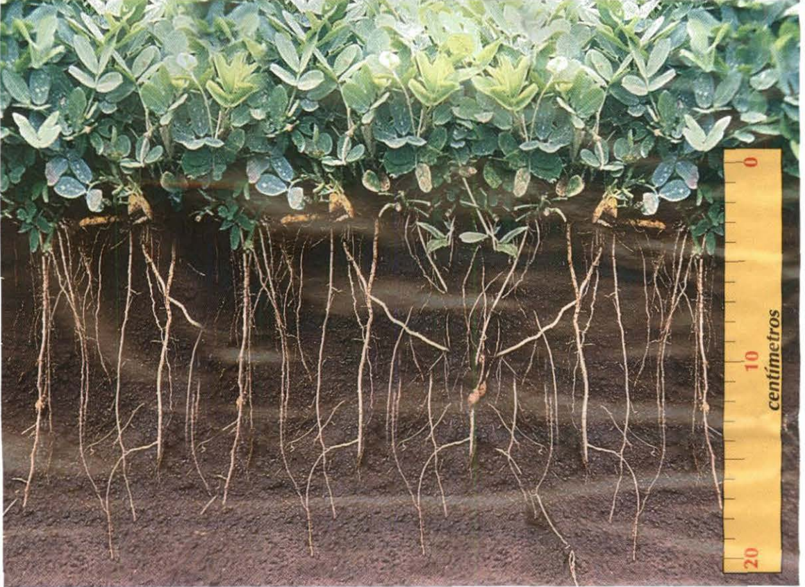
Figura 9. Raíces y frutos (vainas) de A. pintoi cv. Porvenir en la capa superficial del suelo.

La semilla del Maní Forrajero se encuentra en alta proporción (más de 70 %) en los primeros 10 cm del suelo, independiente de la textura de éste como se ilustra en la Figura 9 (Argel et al., 1996). Los rendimientos de semilla dependen del clima y de las características del suelo (Ferguson, 1995), y obviamente de la eficiencia de la cosecha, la cual se facilita en suelos arenosos o franco-arenosos fáciles de romper y zarandear. En suelos de mediana fertilidad localizados en climas intermedios y con buena distribución de lluvias, se han obtenido los rendimientos más altos de semilla en plantaciones establecidas con semilla, en contraste con los establecidos con material vegetativo (Cuadro 6).