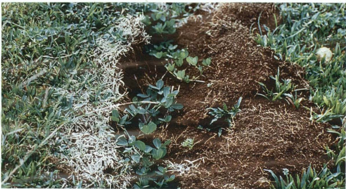
Figura 4. Establecimiento con material vegetativo de A. pintoii cv. Porvenir sobre franjas quemadas con herbicida y luego abiertas con surcador en potreros establecidos con Ratana ( Ischaemum indicum ).

En pasturas ya existentes de gramíneas puras (variedades de Brachiaria o pasto Estrella por ejemplo), el cv. Porvenir puede establecerse en surcos distanciados a 1.0 m. Primero se debe dar un pastoreo a fondo de la gramínea, luego se queman franjas con herbicidas no selectivos como glifosato (Roundup). Sobre las franjas quemadas se pueden abrir surcos donde se colocan los estolones o la semilla (Figura 4); alternativamente se puede sembrar a chuzo sobre la franja quemada si no se dispone de maquinaria o bueyes para abrir surcos. En este caso se recomienda el mismo manejo pos-siembra que el descrito anteriormente, o sea pastorear el potrero lo antes posible, ojalá dentro de la rotación normal de uso si el ganadero tiene establecido un sistema rotacional de pastoreo en su finca, por ejemplo de 7 días de ocupación y 30 de descanso.