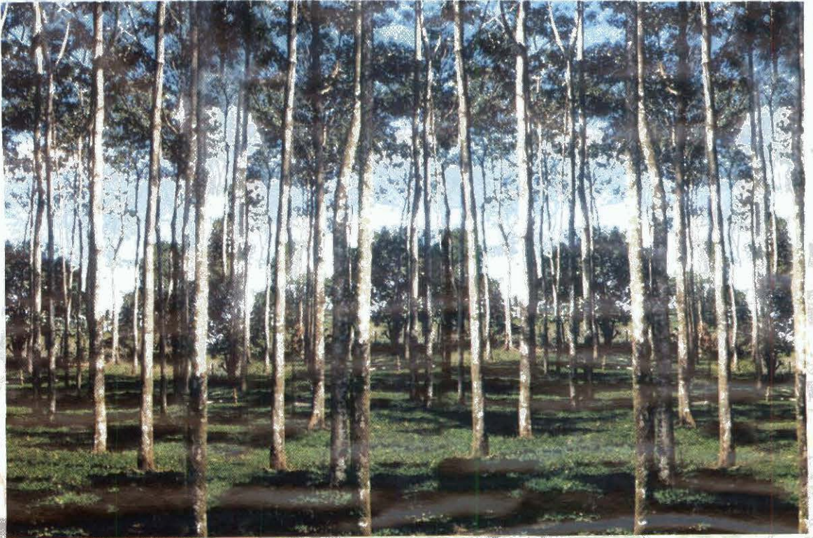
Figura 7. Utilización de A. pintoi cv. Porvenir como cobertura en una plantación de Laurel ( Cordia alliodora ).

Por el contrario, Pérez (1997) encontró después de cuatro ciclos de cosecha de banano cv. Gran Enano con cobertura de los cvs. Maní Mejorador y Porvenir, valores significativos mayores de área foliar, peso del racimo y número de manos por racimo, en comparación con el testigo sin cobertura. En este caso el Maní se sembró tres meses después de establecido el banano y no se reporta competencia por nutrientes entre las dos especies, contrario a lo reportado por Vargas (1997) en banano y plátano establecidos en un área de una accesión diferente de A. pintoi (CIAT 18748), de seis años de edad. Aquí el Maní redujo el crecimiento y vigor inicial de los cultivos, lo cual estuvo asociado con menores niveles foliares de P, Mn y K en los mismos. Pareciera que el Maní Perenne compite fuertemente por nutrientes si se establece en forma simultánea con cultivos perennes, o inicialmente cuando se plantan cultivos en áreas ya establecidas con la leguminosa.