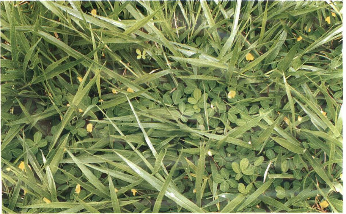
Figura 5. Crecimiento y proporción de A. pintoii cv. Porvenir dos años después de establecido por medios vegetativos en un potrero de 15 años de edad de B. decumbens cv. Pasto Peludo (Basilisk).

Siguiendo las recomendaciones anteriores se estableció exitosamente el cv. Porvenir en pasturas de Brachiaria decumbens cv. Pasto Peludo (Basilisk) de 15 años de edad en predios de la Escuela Centro Americana de Ganadería en Atenas (Jesús González, comunicación personal). Cinco meses después de la siembra la proporción de Maní fue de 10 %, pero este se ha incrementado y estabilizado en aproximadamente 40 % dos años después, como lo muestra la Figura 5; además, en la pastura asociada de gramínea / leguminosa la disponibilidad de forraje es aproximadamente de 620 kg más de materia seca cada 35 días que en el Pasto Peludo sin la leguminosa. El costo de establecer 1.0 ha con este sistema, incluyendo corte y acarreo de estolones, rayado con cincel y mano de obra para la siembra, fue de 183 dólares.