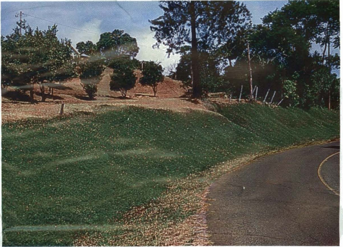
Figura 8. Utilización de A. pintoi cv. Porvenir para controlar erosión del suelo en taludes de una vía pública.

La utilización del cv. Porvenir para reducir erosión del suelo en áreas de ladera con fuertes pendientes y a lo largo de taludes desnudos en las vías públicas, es de amplio uso en Costa Rica (Figura 8). Al momento no se dispone de cifras sobre área total sembrada, ni de la cantidad de suelo que se conserva con la cobertura del Maní, pero dado el buen cubrimiento de éste, las pérdidas de suelo deben ser mínimas.