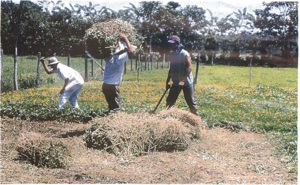
Figura 3. Desarrollo y corte para siembra de estolones con más de 8 semanas de edad de A. pintoii cv. Porvenir