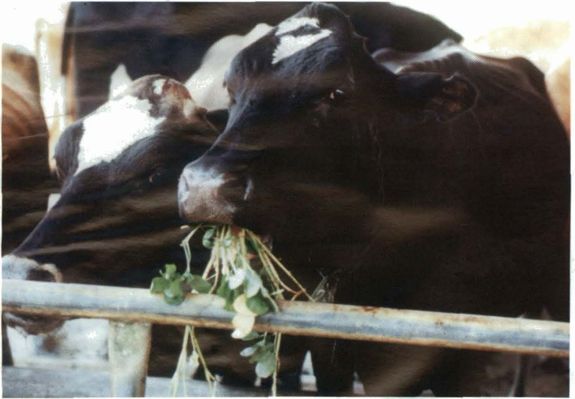
Figura 6. Consumo de A. pintoi cv. Porvenir por vacas de leche

La buena calidad forrajera del cv. Porvenir se refleja en altos índices de producción animal. El Cuadro 4 muestra ganancias de peso en terneras Jersey de reemplazo, con acceso por 5 horas diarias de pastoreo a un banco de la leguminosa de 34 días de recuperación. La gramínea acompañante estuvo formada por una mezcla de pasto Estrella y Kikuyo, fertilizados con 250 kg/ha de nitrógeno (Quan et al., 1996). La alta calidad forrajera del cv. Porvenir compensó la disminución en cantidad de concentrado ofrecido a las terneras, y cuando éstas tuvieron acceso al banco de leguminosa, ganaron significativamente más peso que el grupo mantenido sólo con concentrado. No solamente se tuvo un sistema más económico de alimentación basado en la leguminosa, sino también terneras de mayor peso.