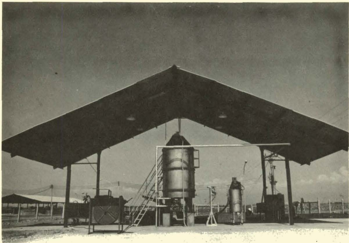
Fig. 2 Vista de la planta piloto en la Unidad de Porcinos del CIAT para producir proteina microbial utilizando raices de yuca como medio de cultivo.