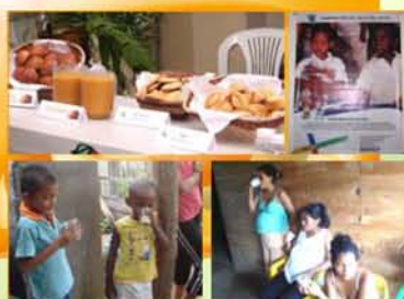
Figura 7. Esquema de distribución masiva de alimentos.

Los alimentos de alto valor nutricional desarrollados pueden ser promovidos a bajo costo y distribuidos en programas de ayuda alimentaria dirigidos a niños en edad escolar y a mujeres embarazadas y lactantes de países en mayor riesgo nutricional (Figura 7).