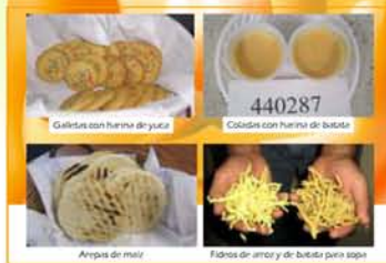
Figura 3. Productos alimenticios elaborados.