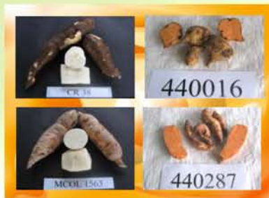
Figura 1. Algunas variedades de yuca y batata seleccionadas.