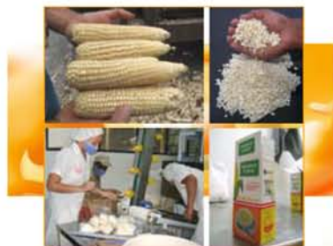
Figura 6. Producto de maíz QPM desarrollado con Pampa Ltda., Cali-Colombia.

Finalmente, con el objetivo de identificar y establecer canales de difusión y distribución masiva de los productos generados en el proyecto, se trabajó con la empresa privada Pampa Ltda. de Cali-Colombia, para desarrollar diferentes alimentos con los cultivos biofortificados y con potencial para su comercialización en la población de mayor riesgo nutricional. Algunos de los productos generados fueron "Mazamorra EL CHOCCLO" con maíz QPM blanco (Figura 6) y "Fidesopa FENY" con arroz y batata biofortificada.