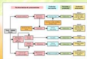
Figura 2. Líneas de proceso identificadas y validadas.

El componente poscosecha del proyecto, liderado por el Consorcio Latinoamericano y del Caribe de Apoyo a la Investigación y al Desarrollo de la Yuca (Clayuca) y la Empresa Brasileira de Pesquisa Agropecuaria (Embrapa), se fundamenta principalmente en la validación de tecnologías para la generación de productos alimenticios basados en variedades biofortificadas de yuca y batata, con inclusión de maíz, arroz y frijol.