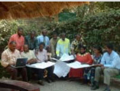
La méthode utilisée par la PABRA pour institutionnaliser l'évaluation et le suivi participatifs met l'accent sur un processus de renforcement des capacités qui stimule l'apprentissage par la pratique.

Les Temps forts présentent les résultats des travaux de recherche menés en Afrique par le CIAT et ses partenaires et les conséquences politiques qui en découlent