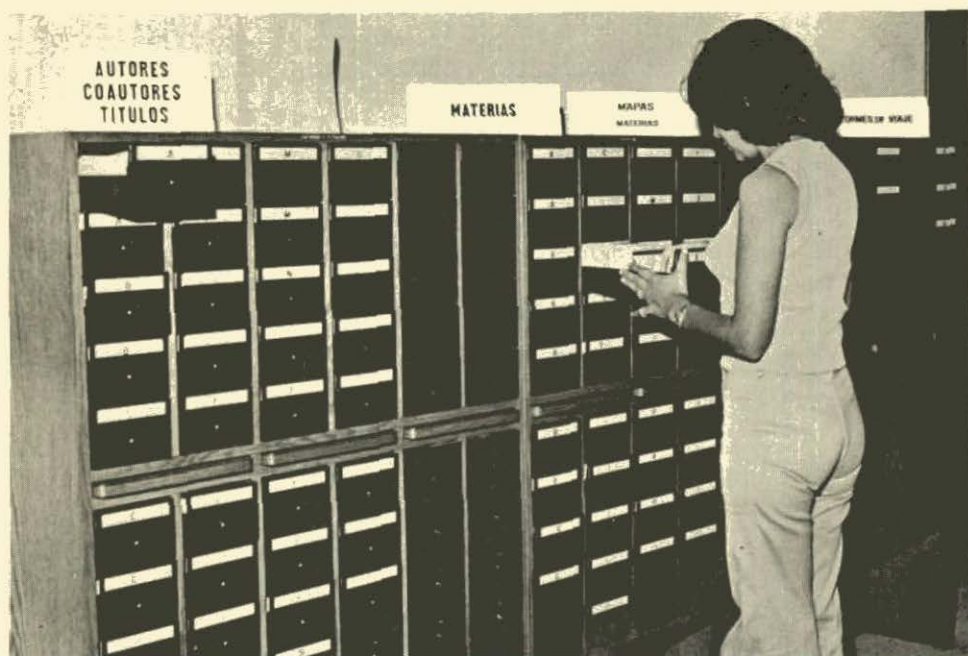
La colección más completa de información sobre la yuca en el mundo.

esta información), las cuales son distribuidas 10 veces al año a más de 2.000 científicos en todo el mundo. Con base en estas tarjetas de resúmenes, los científicos pueden solicitar fotocopias de los artículos completos.