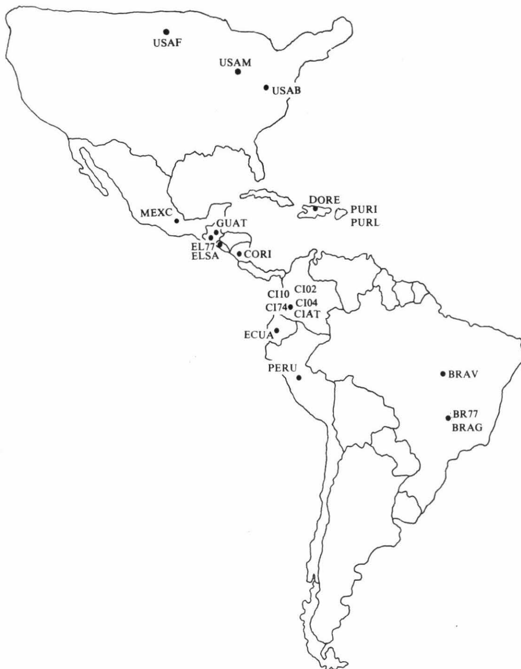
Figura 1. Localización de los ensayos del IBRN en el Hemisferio Occidental, ensayos hechos en 1975 y 1976.