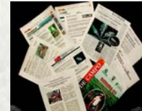
Divulgación. Cobertura periodística

Cerca de 200 agricultores fueron atendidos en el Día de Campo por representantes del Ministerio de Agricultura, el Director de CORPOICA y personal del CIAT. Se realizaron varias presentaciones en las que se describieron los procesos de investigación para el desarrollo de la variedad, sus características agronómicas y recomendaciones de manejo.