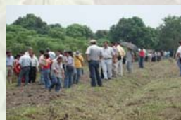
Productores de yuca y técnicos en el Día de Campo

Cerca de 200 agricultores fueron atendidos en el Día de Campo por representantes del Ministerio de Agricultura, el Director de CORPOICA y personal del CIAT. Se realizaron varias presentaciones en las que se describieron los procesos de investigación para el desarrollo de la variedad, sus características agronómicas y recomendaciones de manejo.