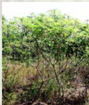
Fig. 2. Porte de la planta

Con el uso de estas escalas se han evaluado más de 6000 cultivares de yuca, donde se han encontrado diferentes niveles de resistencia. La variedad Nataima-31 es el resultado de un cruzamiento entre MEcu 72, proveniente de Zamora, Chinchipe, Ecuador y MBra 12 (colectada en Brasil). MEcu 72 es la madre resistente y MBra 12 fue escogido como el parental masculino, por su rendimiento, sus cualidades agronómicas y culinarias. Del cruce original resultaron 128 progenies F 1 , que fueron evaluadas para resistencia a la mosca blanca, rendimiento y calidad culinaria, en el Centro de Investigaciones de CORPOICA-Nataima, en Espinal, Tolima. De las 128 progenies evaluadas, cuatro (CG 489-31, CG 489-34, CG 489-23 y CG 489-4) fueron seleccionadas por presentar mínimas poblaciones y ausencia de daño, según los criterios de selección citados arriba. El número 31 representa la 31ª progenie de las 128 que fueron evaluadas (Bellotti, 2003).