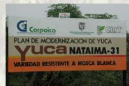
Señales de campo

El 28 de marzo de 2003, en el Centro de Investigaciones Nataima-CORPOICA del Espinal, Tolima, se hizo entrega oficial de la variedad Nataima-31, con registro del ICA 008 del 10 de julio de 2002.