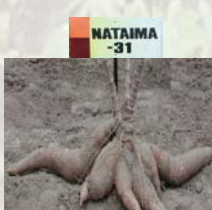
Fig. 3. Raíces de Nataima-31

Por lo tanto, el nombre de Nataima 31 es la combinación de la localidad donde se llevaron a cabo las investigaciones y el número de la progenie seleccionada en CIAT-Palmira. De las cuatro progenies seleccionadas, Nataima 31 es la primera en ser liberada.