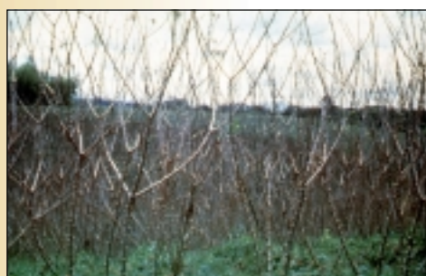
Daño del gusano cachón de la yuca

Cuando el gusano cachón ataca y desarrolla una población alta, llega a defoliar totalmente el cultivo; en consecuencia, hay un descenso considerable en el rendimiento de raíces de yuca (entre el 18% y el 64% del normal).