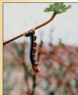
Larva de gusano cachón muerta por infección de Baculovirus de E. ello .

biocidas a base de B. thuringiensis y ofrece además grandes ventajas en la aplicación y en el almacenamiento. El producto se desarrolló mediante un convenio entre el CIAT y BIOCARIBE S.A., en colaboración con el Ministerio de Agricultura y Desarrollo Rural de Colombia (MADR).