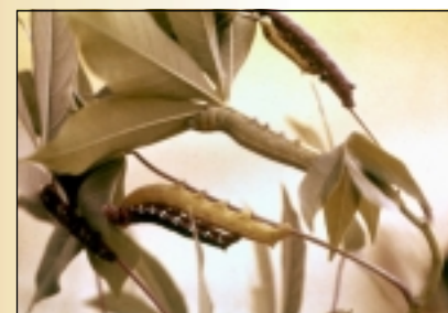
Larvas de gusano cachón

El gusano cachón puede manejarse empleando varios métodos. Entre ellos, el control biológico es el más importante porque no contamina el ambiente y es muy efectivo; vienen luego el método cultural (manejo agronómico) y el mecánico (eliminación manual de larvas). La alternativa de último recurso es el control químico.