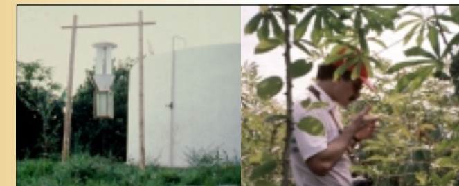
Seguimiento en el campo y trampa de luz

trampa de luz negra (tipo BL o BLB) que atrapan adultos en vuelo, lo que reduce las posturas de huevos en el campo.