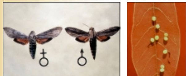
Adultos y huevos del gusano cachón

El gusano cachón de la yuca es una de las plagas más importantes de este cultivo en América tropical. La capacidad migratoria de E. ello , su adaptación a varios climas y su amplio rango de hospederos son las causas de su extensa distribución y de sus ataques esporádicos.