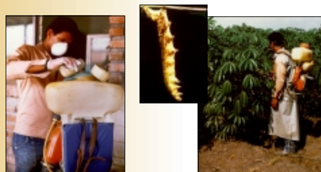
Aplicación del Baculovirus de E. ello en un cultivo de yuca

El producto puede formularse comercialmente en polvo o como un líquido y se aplica siguiendo los métodos convencionales de los plaguicidas químicos.