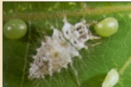
Adulto de Chrysopa spp. (arriba) y ninfa del insecto depredando huevos de E. ello

El estado más agresivo de Chrysopa sp. es el estado ninfal. Una ninfa consume, en promedio, 17 huevos en un periodo de 24 horas.