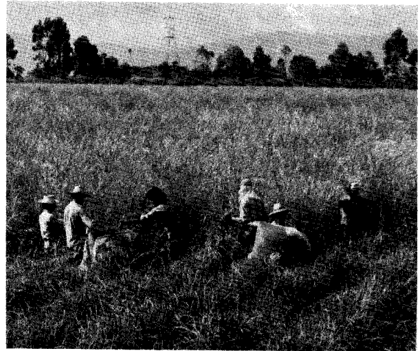
Cosecha manual de tallos florales de Andropogon gayanus.

La tierra. Los rendimientos en semilla de las especies forrajeras son bajos; por lo tanto, se requieren áreas grandes para mantener una empresa económicamente viable. Además, los costos de establecimiento de tales especies son altos, y el ciclo productivo de semilla no suele durar más de dos años. Por el contrario, su valor como pastura