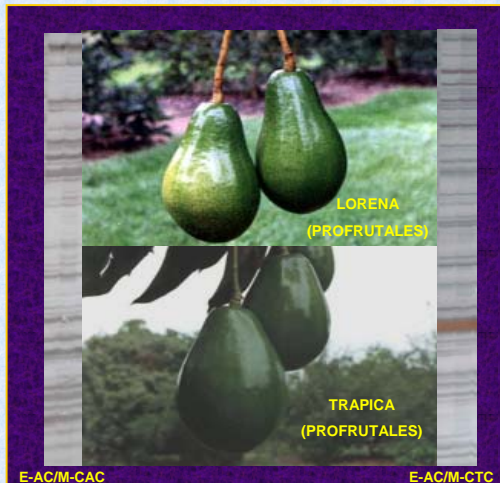
Figura 2. Frutos y perfil molecular de los AFLPs de Lorena y Trapica.

El posible duplicado genético reportado aquí corresponde a las accesiones "Lorena" y "Trapica", las cuales son similares en el fruto, el hábito de la planta, son de raza Antillana y fueron originadas por selección masal en el Valle, Colombia. Sin embargo, hay algunas diferencias de carácter morfoagronómico entre ellas (Rios-Castaño, com. personal; Rios-Castaño y col, 2005). Por lo tanto, lo más prudente es proponerlas como un posible duplicado genético de la colección colombiana de aguacate (Fig. 2).