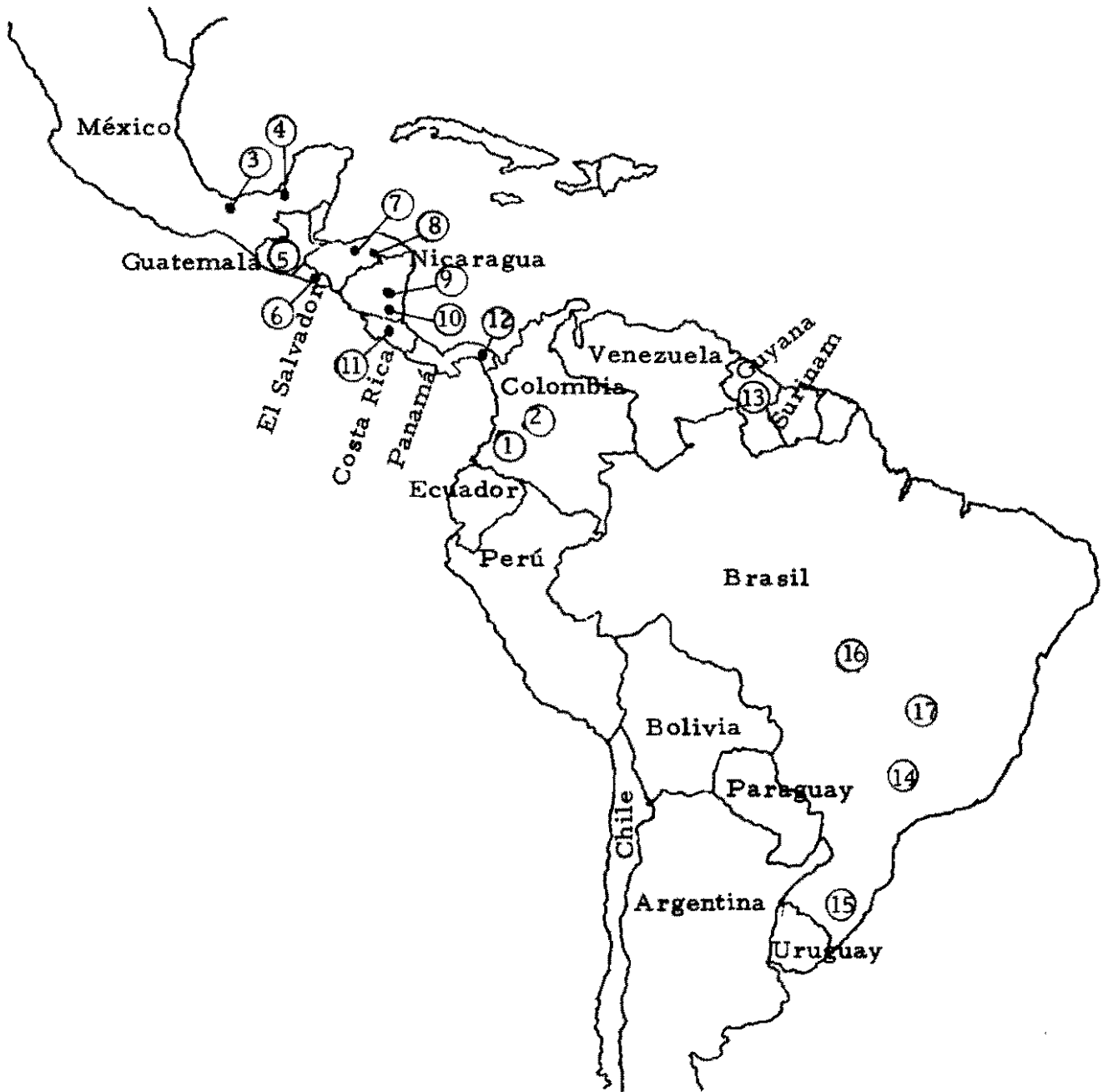
Figura 1. Localidades donde se sembró el Primer VIRAL-T en 1977